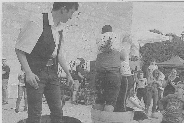
Pisada de la uva por los quintos en la plaza de los Negrillos. | Foto J. V.