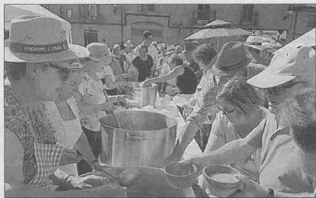
Grandes cazuelas para la comida multitudinaria