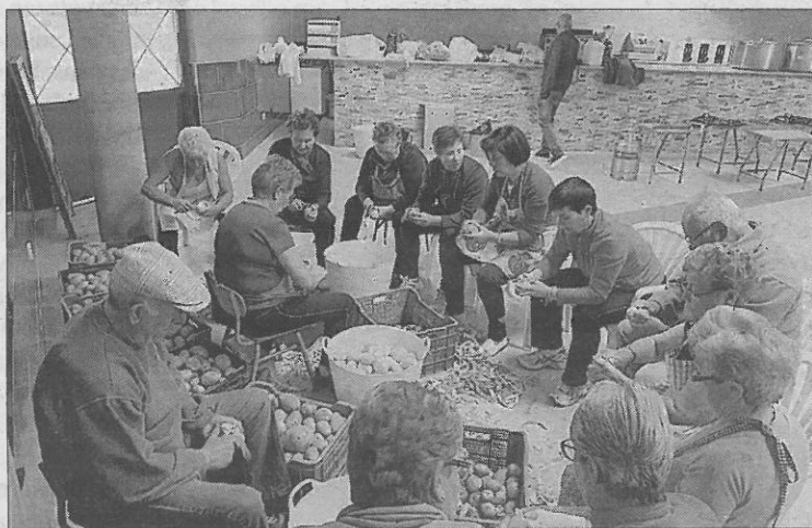
Los voluntarios pelando patatas para la comida.