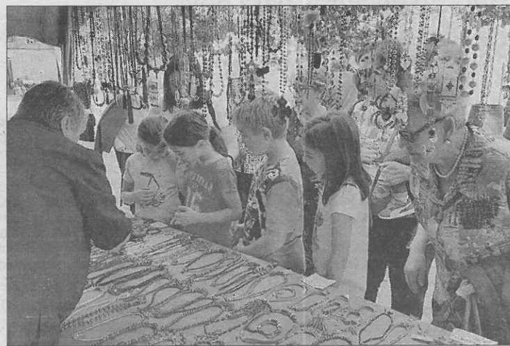
Uno de los puestos de bisutería durante la fiesta.