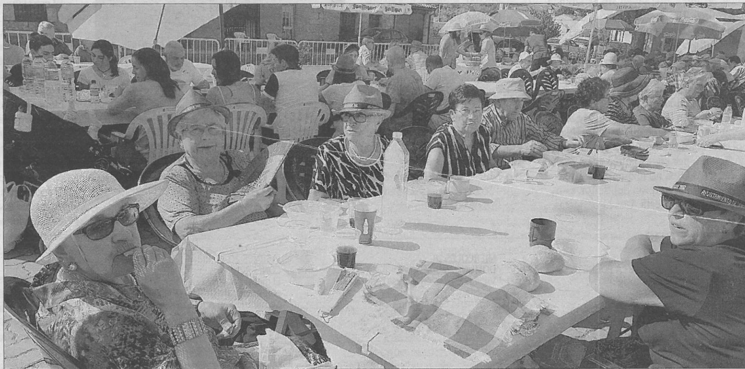
Los comensales llenan las mesas durante la comida de la fiesta de la vendimia celebrada ayer en Venialbo.