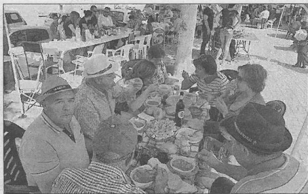
Las mesas repletas para disfrutar de la comida.